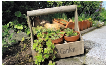
Bergilex (Ilex crenata)