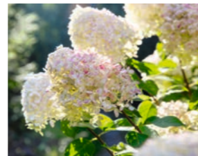
Spätblüher: Rispenhortensien blühen als letzte Hortensienart. Ihr Schnitt sollte im Winter erfolgen.