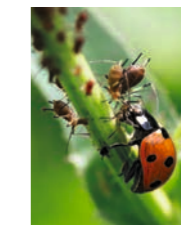
Marienkäfer: Lebende Pflanzenschutzmittel