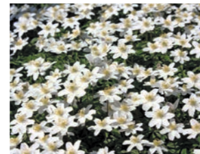
Frühblüher: Die Wohlfühlzone der Buschwindröschen sind Laubbäume oder Sträucher.