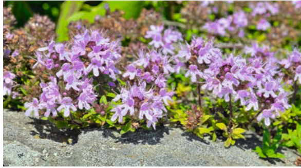
Pflegeleichter Bodendecker: Polsterthymian unterdrückt nicht nur unerwünschten Wildwuchs, er duftet auch toll und erfreut Insekten im Juli und August mit seinen Blüten.